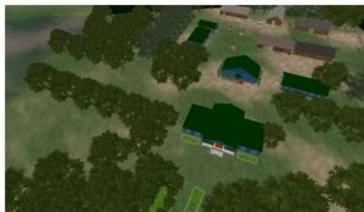
Рис. 3. Вид сверху на модель усадьбы семьи Вернадских