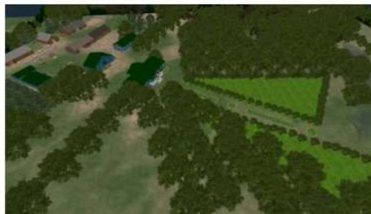
Рис. 2. Общий вид модели усадьбы семьи Вернадских

Возвращаясь к историческим фактам, следует отметить, что Владимир Иванович лично побывал в Вернадовке и летом 1891 года, когда в губернии второй год подряд «случился неурожай». В 1892 году Вернадский вновь посетил имение, окрестные деревни, земскую управу в Моршанске, поместье Любощинского в Козловском уезде [3, с. 251, 253-254, 256, 268, 271, 272, 282 - 284]. Организация помощи голодающим, а затем и больным, довольно подробно описана в научной литературе [1, с. 83 - 88; 23].